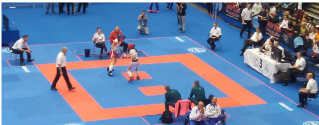
Exemple tatami compétition WAKO kick light

Une limite d'au moins 2 mètres doit être respectée entre chaque aire de rencontre lors de compétitions multi surfaces.